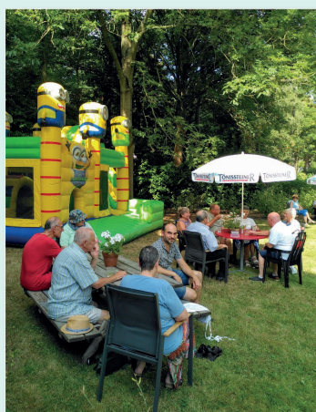
Buurtfeest in 't Karwei