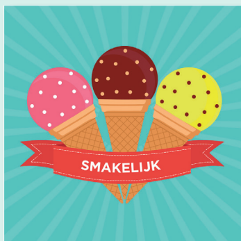
Een ijsje op de dag van de zorg