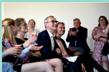
Minister Vandenbroucke op studiedag mArquee