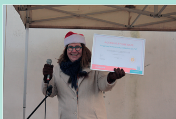
Uitreiking van ons gouden label