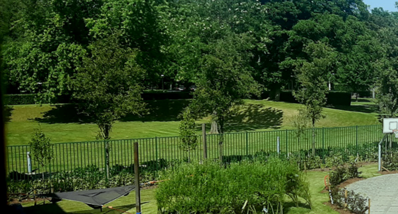
Juni 2023 – Nieuwe therapeutische tuin van GAUZZ